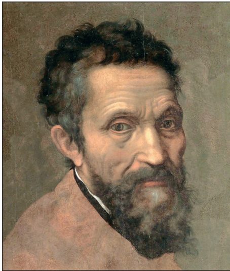
Daniele Volterra Michelangelo um 1544

Michelangelo – Anmalen und weitergestalten gehört zu der neuartigen Schulmalbuchreihe, die als Schülerarbeitsbuch oder als Kopiervorlagenwerk einsetzbar ist. Sie führt konzeptionell innovativ und genial einfach direkt in das Leben und in das Werk der großen internationalen Künstler aus Vergangenheit und Gegenwart ein. Schülerinnen und Schüler aller Klassen und Schulformen erwerben begeistert Wissen, malen Bilder farbenprächtig an und gestalten sie ideenreich weiter. Mit fantastischen Ergebnissen belohnen sie sich und werden schnell Kunstexperte. Lehr- und Lerneffizienz sind garantiert.