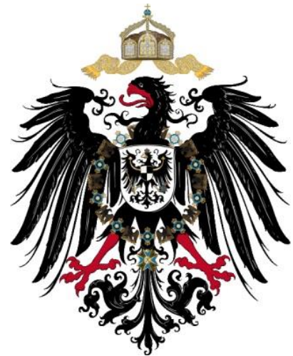
Das Wappen des Deutschen Kaiserreichs

Als Ersatz für das Dreikaiserabkommen verabreden Deutschland, Russland und Österreich-Ungarn 1881 den Dreikaiserbund , um im Falle eines Krieges mit äußeren Mächten die übrigen Partner neutral zu halten.