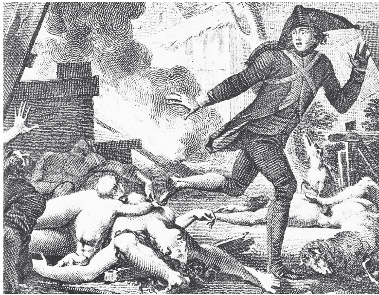
Illustration: Jean-Michel Moreau (le Jeune).

Der gutgläubige Optimist Candide erlebt auf seiner abenteuerlichen Reise eine Katastrophe nach der anderen. Werden seine Erfahrungen seine Einstellung ändern?