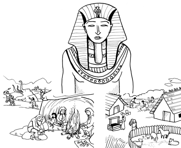
Ausmalbilder, Rätsel, Spiele – motivierende Einstiege nach den Sommerferien

Dieser Beitrag bietet Ideen für Einstiegsstunden nach den Sommerferien – von Klasse 5 bis 10. Er zeigt Wege, die Jugendlichen neu für ein altes Fach zu begeistern und den Stoff des vergangenen Jahres in spielerischer Weise wieder aufzugreifen. Neben dem vergnüglichen Rätselspaß und der Erkenntnis, wie viel Vorwissen noch vorhanden ist, besteht ebenso die Möglichkeit, Themen noch einmal zu problematisieren und ihre Bedeutung für die weitere historische Entwicklung aufzuzeigen.