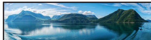
Landschaft in Norwegen mit Fjorden

In Europa gibt es erstaunlich viele Landschaften und Lebensräume. Im Norden und Osten des Festlands erstreckt sich eine riesige _____. Sie reicht von den Niederlanden bis in die Ukraine und ist durchzogen von Marschlandschaften, _____ und Seen.