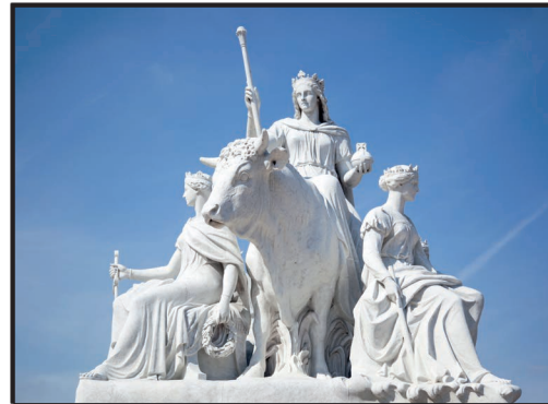
Die schöne Europa mit Gottvater Zeus in Gestalt eines Tieres

Europa ist nach Australien der zweitkleinste Kontinent aber äußerst vielfältig. Seinen Namen verdankt er einer Königstochter aus der griechischen Sage: die schöne Europa, Tochter von König Agenor, wurde von dem obersten Gott _____ in Gestalt eines weißen Stiers ins Mittelmeer entführt. Zeus schwamm mit ihr bis nach Kreta und machte sie zur Königin der Insel. Seit der Antike heißt der ganze Kontinent Europa.