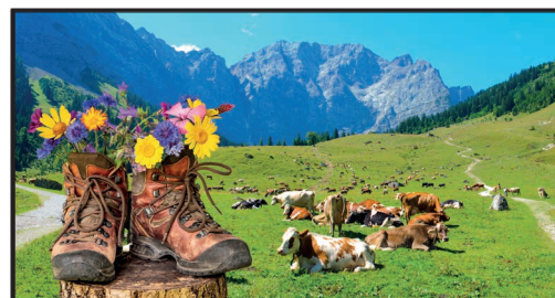
Die bayerischen Alpen

Gebirge, Hügelländer, Ebenen, Flusstäler, Hochflächen und Küstenebenen wechseln häufig innerhalb kurzer Entfernungen. Die Alpen, das bedeutendste europäische Hochgebirge, trennt den Mittelmeerraum von Nord- und _____.