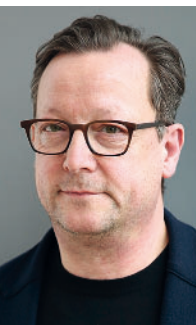
Matthias Brandt (*1961)