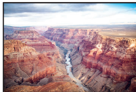
Der Grand Canyon

Das Land weist aufgrund seiner Größe ein vielfältiges Landschaftsbild auf. Es wird geprägt von den in Nord-Süd-Richtung verlaufenden Gebirgszügen, den _____, zwischen denen ausgedehnte Tiefländer liegen. Im Westteil des Kontinents erstrecken sich von Nord nach Süd die _____. Östlich davon liegen die fruchtbaren Ebenen, die Great Plains, wo es einst Rinderfarmen gab und Cowboys und _____ lebten.