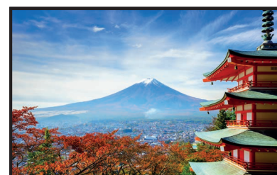
Fujisan – der höchste Berg Japans