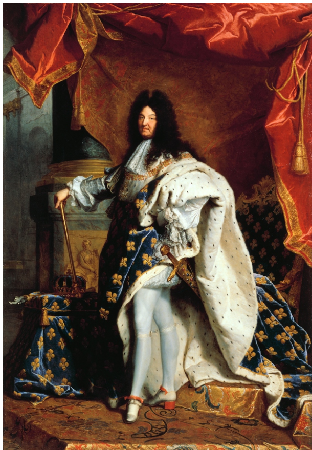
Hyacinthe Rigaud Porträt des französischen Königs Ludwig XIV. 1701

Der Barock, die sich auf die Renaissance und den Manierismus anschließende Epoche um 1600 bis 1700, hat ihren Anfang am Ende des 16. Jahrhunderts in Italien und wird mit fließenden Übergängen in den Früh-, Hoch- und Spätbarock eingeteilt. Die Epoche Rokoko wird gelegentlich dem späten Barock zugeordnet. Er war besonders stark vom Einfluss der Kirche und der Herrscher geprägt. Widersprüche und Gegensätze in der Gesellschaft zeigte er, auf der einen Seite Macht, Reichtum, Verherrlichung (Foto) und Leichtigkeit, auf der anderen Seite alltägliche Armut, Elend, Tod und harte Arbeit in den unteren Bevölkerungsschichten, die noch besonders von den Schrecken des Dreißigjährigen Krieges und einer tiefen Gläubigkeit an christliche Religion geprägt waren. Die Seiten zeigten sich in der Kunst und anderen kulturellen Bereichen. Neue Inhalte und Stilelemente setzte er ein. Seit der Mitte des 19. Jahrhunderts fand der Epochenbegriff allgemeine Gültigkeit.