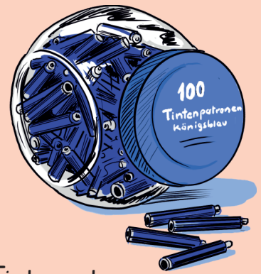
Tintenpatronen 100 Stück

Pass auf dein Taschengeld auf! – Bestell-Nr. 12 977