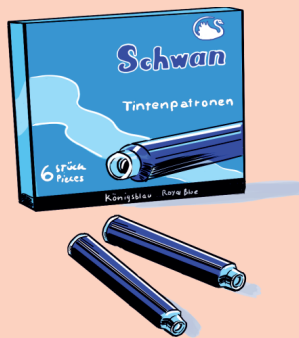
Tintenpatronen 6 Stück

Pass auf dein Taschengeld auf! – Bestell-Nr. 12 977