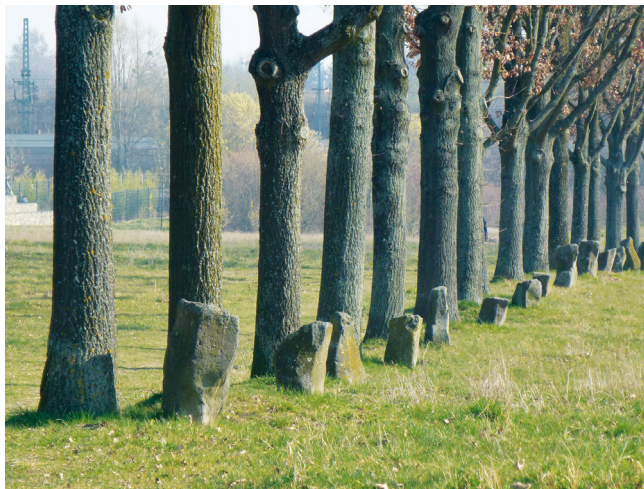
Joseph Beuys: „Stadtverwaltung statt Stadtverwaltung“ (Aktion 7000 Eichen), 1982; Eichen und Basaltstelen, Kassel