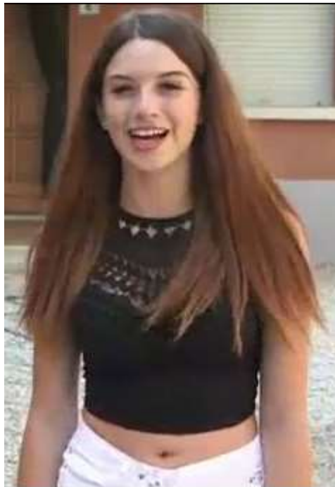
Bildausschnitt aus dem Video

“Io ci _____ molto al mio look, infatti se non ho un vestito alla moda io non _____!”