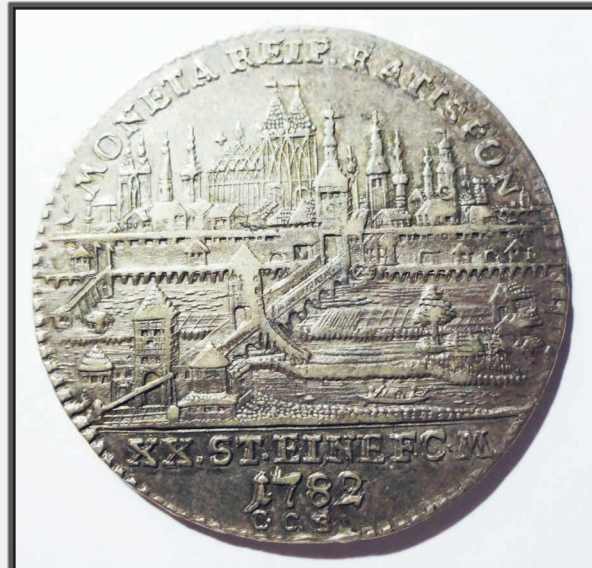
Regensburg auf einer Halbtaler-Münze

Trotz der Bezeichnung Heiliges Römisches Reich Deutscher Nation war ein deutsches Nationalgefühl bei den Landesherrschern und ebenfalls in der sonstigen Bevölkerung – wenn überhaupt – allenfalls (sehr) gering vorhanden.