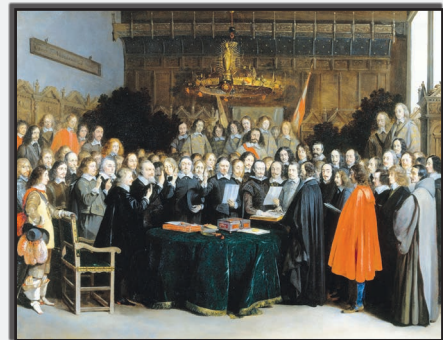
Gesandte beschwören den Westfälischen Frieden im Rathaussaal Münster.