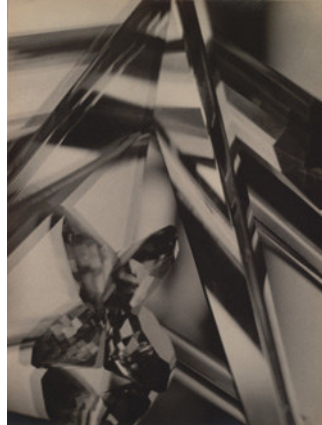
Alvin Langdon Coburn: „Der Oktopus“ (1909) und „Vortographs“ (1916/17) © Alvin Langdon Coburn

Die Serie der „Vortographs“ von Alvin Langdon Coburn markiert die Geburtsstunde der abstrakten Fotografie. Zwar hatte man in Experimenten mit lichtempfindlichen Materialien schon zuvor ungegenständliche Ergebnisse erzielt, doch ist es der Verdienst Coburns, diese Ästhetik erstmalig systematisch verfolgt zu haben. Mit einer Spiegelkonstruktion, dem „Vortoskop“, löste er das fotografische Bild optisch von seinem vorgängigen Gegenstand. Dies führte zu einem Bruch mit der damals üblichen, indes bis heute gängigen Vorstellung von der Fotografie als Spiegel der Realität.