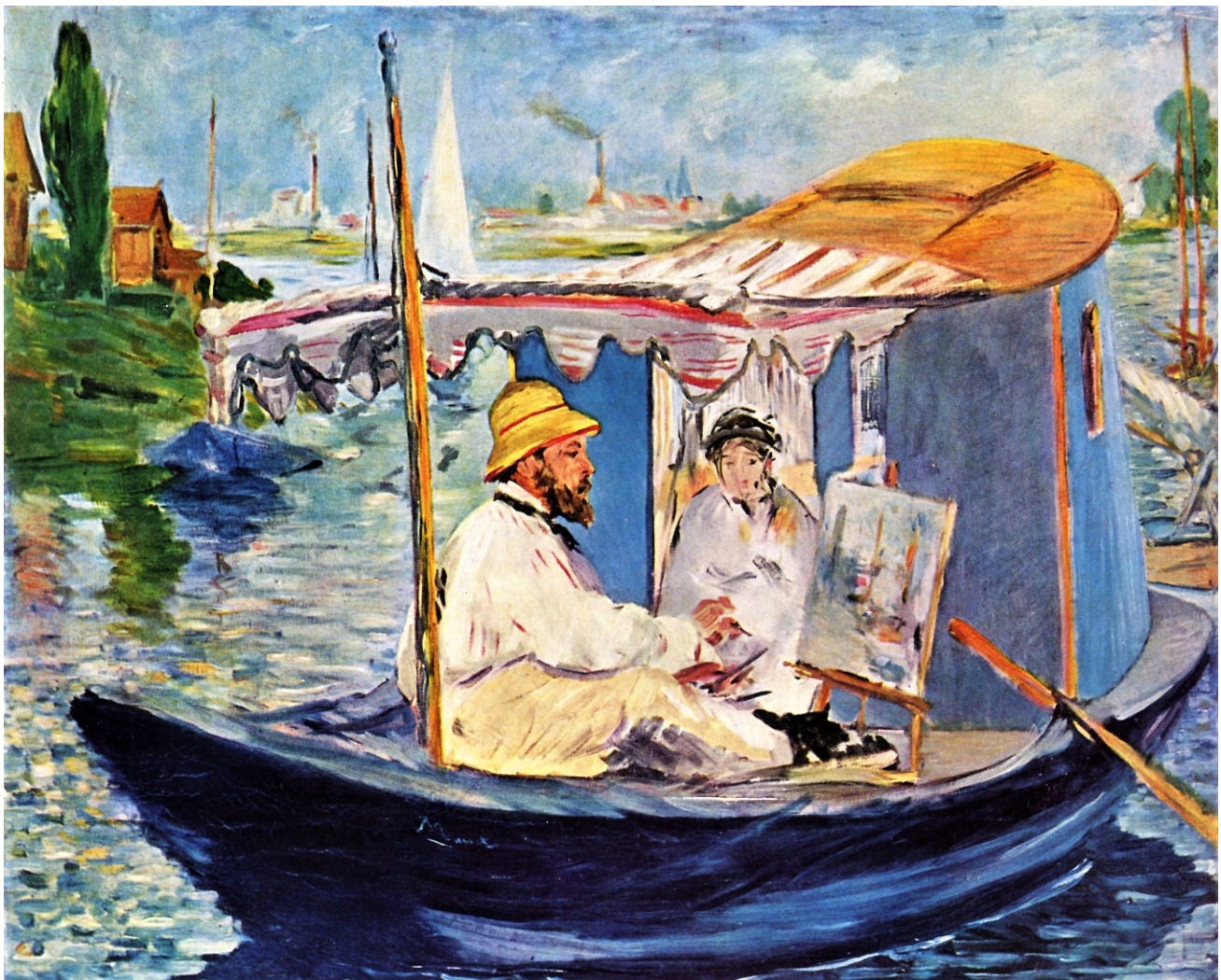
Édouard Manet Claude Monet in seinem Atelierboot 1874