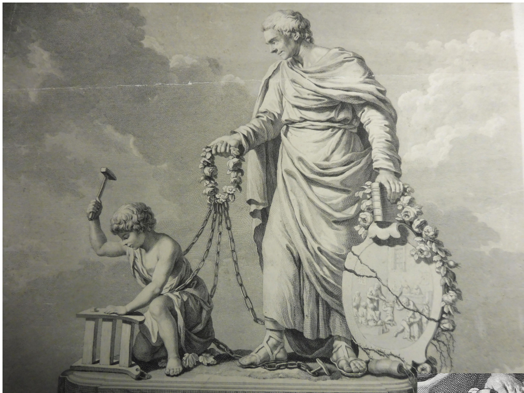
© Kupferstich von Le Barbier, gemeinfrei