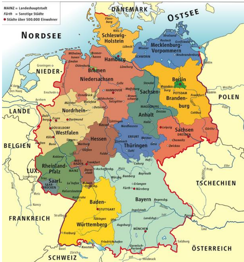
Abb. 1: Politische Karte Deutschlands