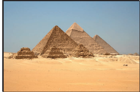
Die Pyramiden von Gizeh