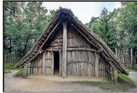
Nachgebildetes Langhaus im Freilichtmuseum Oerlinghausen

Die Jungsteinzeit war der letzte Abschnitt der Steinzeit. Anfangs waren die Jagd und das Sammeln noch fester Bestandteil der Nahrung. Doch dann wurden die Menschen nach und nach sesshaft. Sie begannen Häuser zu bauen, Haustiere zu halten und bauten Getreide an. Sie legten Vorräte an und trieben mit ihren überschüssigen Nahrungsmitteln Handel. Sie fingen an zu töpfern. Das geschah aber nicht alles auf einmal und nicht überall gleichzeitig. Diese Lebensweise begann in Mesopotamien (Vorderasien) und breitete sich dann bis zu uns nach Europa aus.