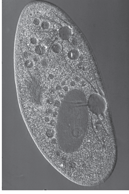
vor 3,5 Mrd. Jahren (3.30 Uhr): erstes Leben (Einzeller)

vor 570 Mio. Jahren (10.38 Uhr): Beginn des Paläozoikums (Erdaltertum): Mehrzeller, Begrünung der Erde, Lurche gehen an Land