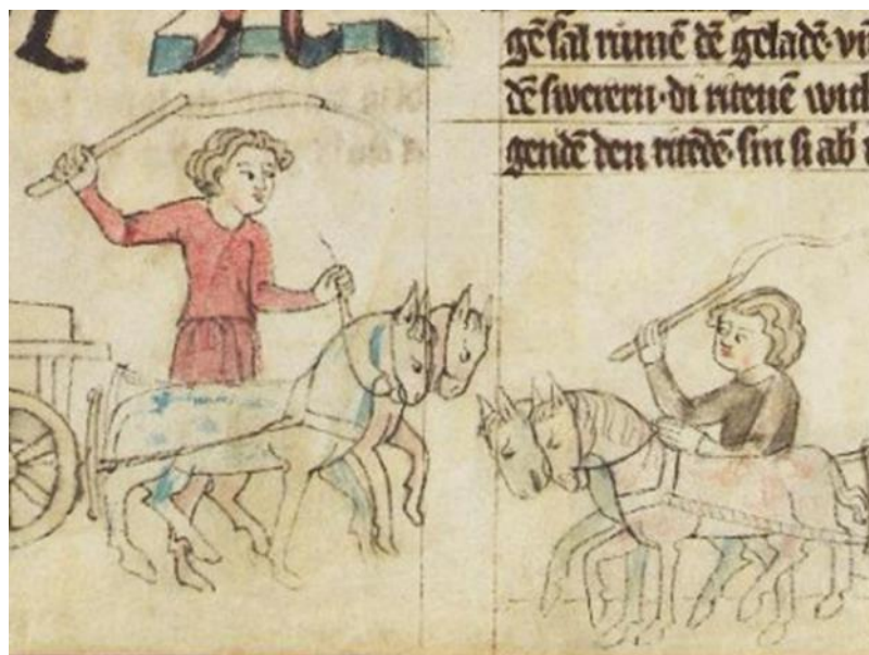
M3 - Wer zuerst kommt, mahlt zuerst (Quelle: www.sachsenspiegel-online.de )

M4 – Der Sachsenspiegel aus dem 13. Jahrhundert schreibt über die damalige Fahrordnung: