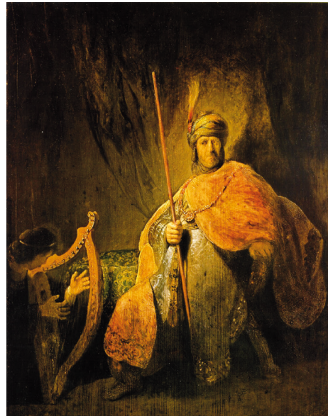
Rembrandt (um 1630)

„Wir wollen einen König so wie andere Völker auch!“, riefen die Israeliten. Und Samuel wurde von Gott beauftragt, diesen zu finden. In dieser Unterrichtseinheit geht es um Saul, den ersten König Israels. Durch zahlreiche Alltagsbezüge (z. B. Erlebnisse von Erfolg und Scheitern) können sich die Schüler in die Thematik hineinversetzen und durch Rollenspiele u. v. m. wird das Gelernte gefestigt.