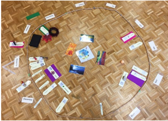
Aufbau der Kirchenjahreskette vgl. u. M3

Die Kirchenjahreskette ist eine zusätzliche Erweiterung dieser Jahreskette. Sie kombiniert diese zyklische Rhythmisierung des weltlichen Kalenders mit der Einteilung des Kirchenjahres.