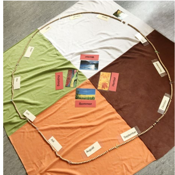
Basismaterial der Jahreskette: Jahreszeitenteppich mit Perlenkette und Monatskarten.