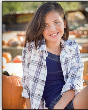
Olivia Amérique du Nord (Montana)