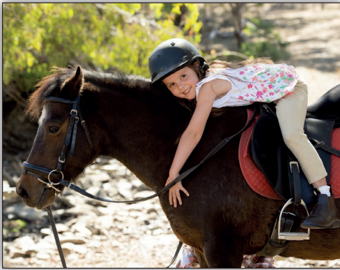
Antonia Amérique du Sud (Argentine)