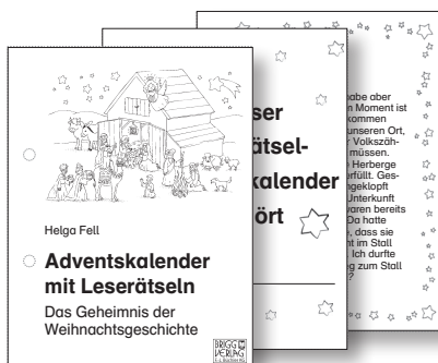
Die Seiten des Mäppchenbüchleins kopieren, ausschneiden und lochen.