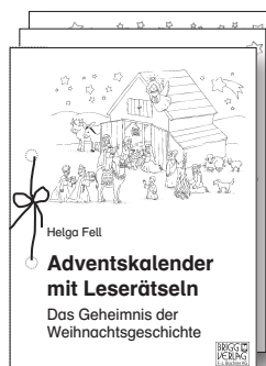
Die Seiten aufeinanderlegen und mit einem Bändchen zusammenbinden.