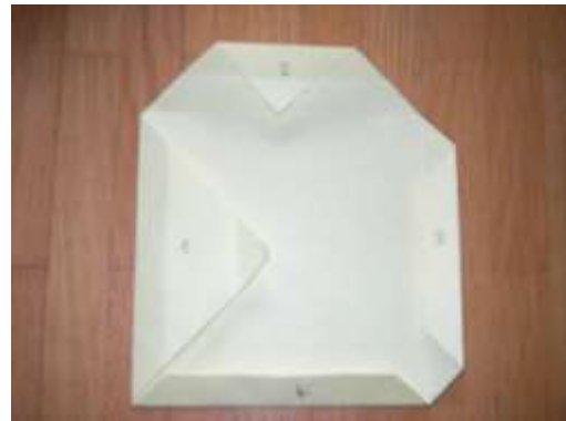
Foto Deckblatt und Faltung Rahmen