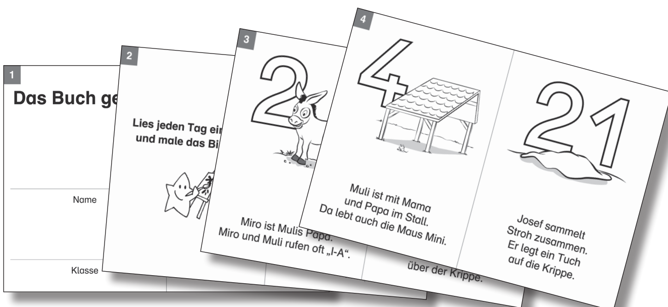
Anordnung/Sortierung der Seiten des Adventskalenders im Hosentaschenformat