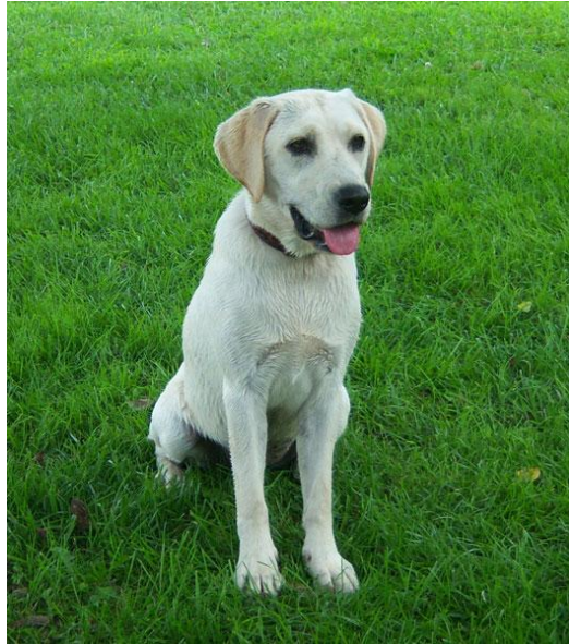
Abb. 2: Arko

Du möchtest deinen entlaufenen Hund Arko wiederfinden. Damit du dieses Ziel erreichst, ist es wichtig, dass du an deinen Gesprächspartner denkst und ihm alle wichtigen Informationen lieferst, die dieser braucht, um den Hund zu erkennen.