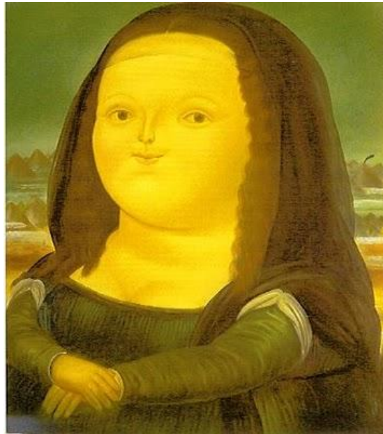
©Foto Mona Lisa a los 12 años en: http://pintores-colombianos.blogspot.com

Lectura y conversación: Lesen Sie bitte den folgenden Text und beantworten Sie anschließend die Fragen.