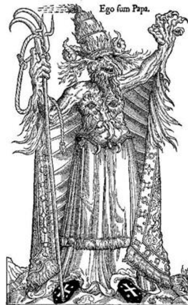
M4 Flugblatt aus der Reformationszeit mit dem Titel „Ego sum Papa“ (dt.: Ich bin der Papst.) gegen Papst Alexander VI., unbekannter Grafiker, 16. Jahrhundert