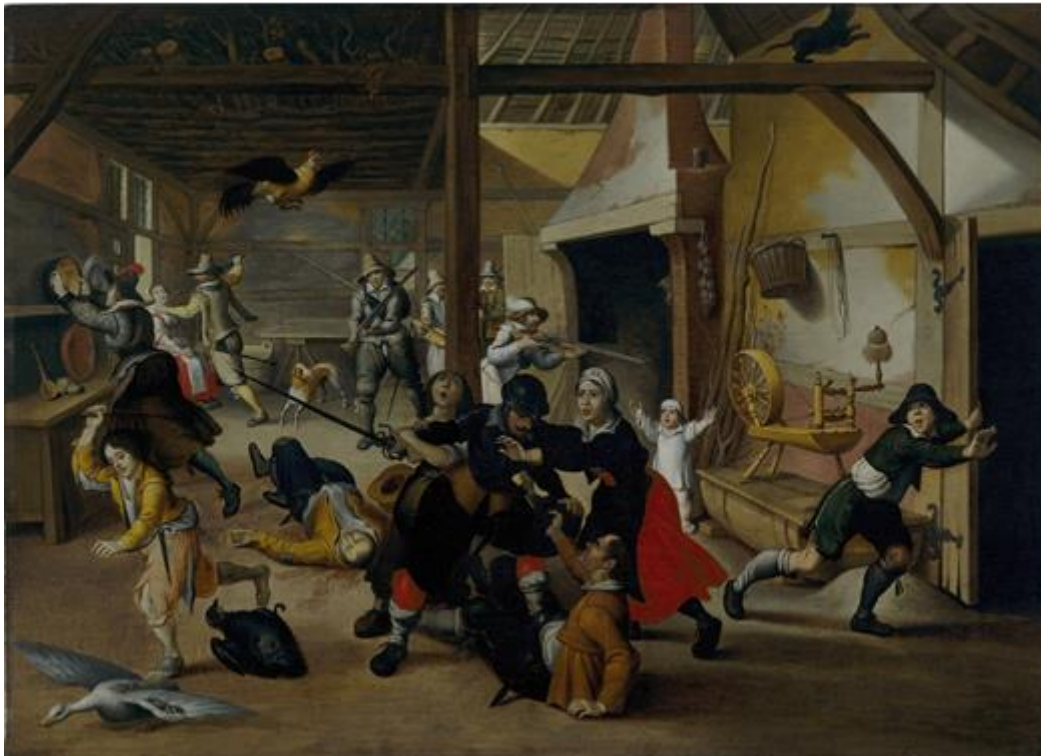
M7 Soldaten plündern einen Bauernhof im Dreißigjährigen Krieg, Gemälde von Sebastian Vrancx, 1620

12. Die wesentlichen Kriegsgegner während des Dreißigjährigen Krieges waren der Kaiser, Frankreich und Schweden, der böhmische Adel, die Protestanten und die Katholiken. Ordne die Satzteile unten der richtigen Kriegspartei so zu, dass verständlich wird, welche Akteure welche Interessen in diesem Krieg verfolgten.