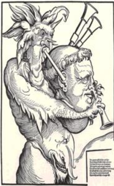
M3 Teufel mit Luther als Sackpfeife, von Erhard Schoen (†1542), um 1535 (commons.wikimedia.org / gemeinfrei)