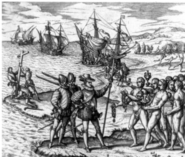
M1 – Kolumbus trifft bei seiner Ankunft auf Indios (Kupferstich, von Theodore de Bry)