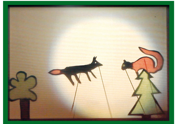
Wer ist schlauer – Fuchs oder Eichhörnchen?

Schattenspiele üben nicht nur auf Kinder eine große Faszination aus. Wer mit den eigenen Händen schon einmal Schattenbilder an der Wand ausprobiert hat, weiß, wie viel Freude es macht. Die Schüler erarbeiten in dieser Unterrichtseinheit nach spannenden Wahrnehmungsübungen und Schattenexperimenten ihre eigene Schattenfigur aus Papier. Bewegliche Glieder machen diese lebendig und sorgen für einen differenzierten Ausdruck. Bühne frei!