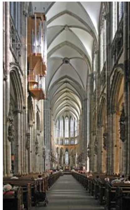
M3 - Kölner Dom, Grundriss und Spitzbogen