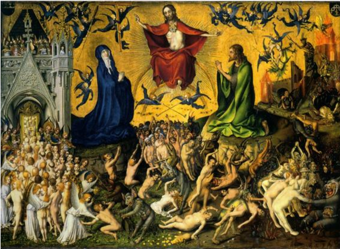
M1 „Das Jüngste Gericht“ von Stefan Lochner, um 1435 entstanden