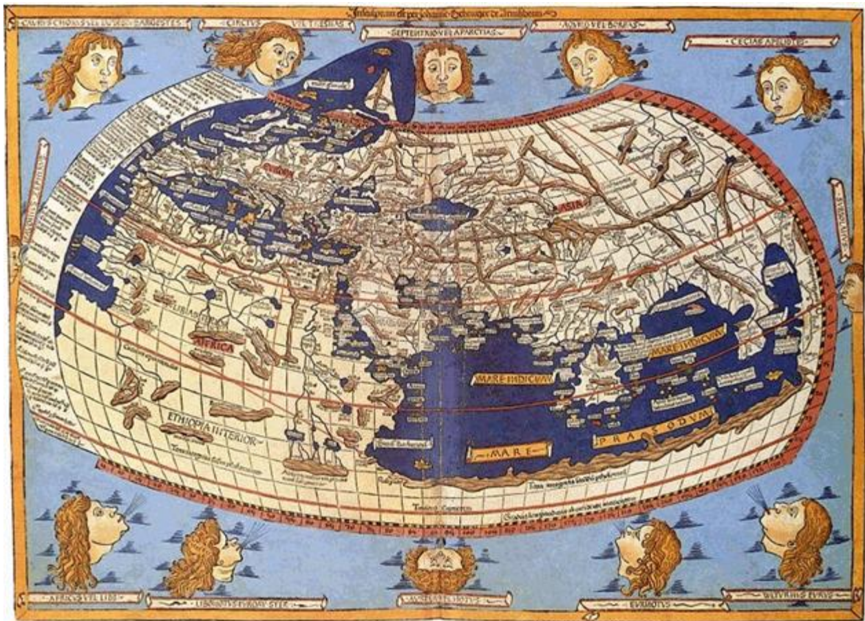
M4 - Weltkarte des Ptolemäus (150 v. Chr.)