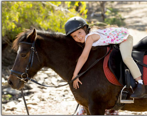
Antonia d'Amérique du Sud (Argentine)