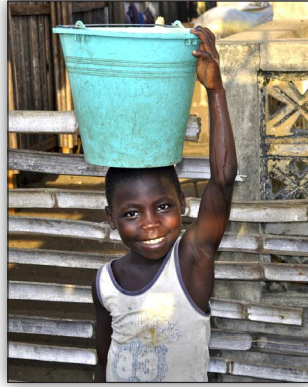
Bandele d'Afrique (Kenya)