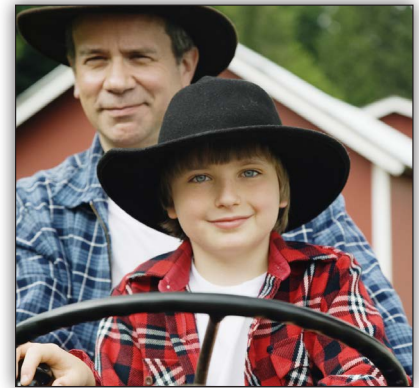
Jim d'Australie (Flinders Ranges)