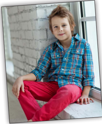
Hannes d'Europe (Allemagne)