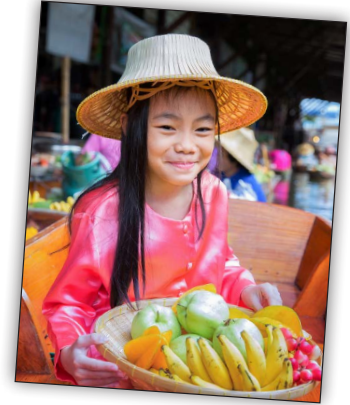
Narisara d'Asie (Thaïlande)