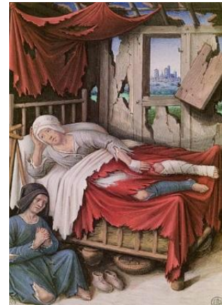
M2 Drei Familien in der Stadt, Gemälde von Jean Bourdichon, 15. Jahrhundert