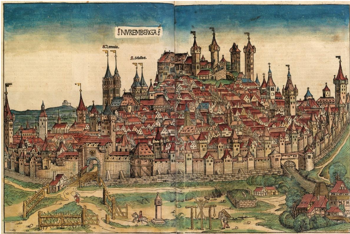
M1 Die Stadt im Mittelalter, älteste gedruckte Ansicht Nürnbergs, Schedelsche Weltchronik 1493