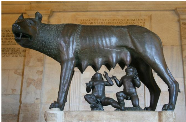
M1 Die kapitolinische Wölfin säugt die Knaben Romulus und Remus (diese wurden später zu der Figur hinzugefügt)