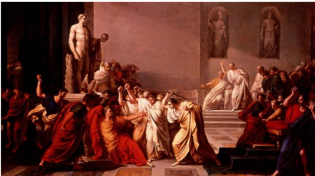
M7 Gemälde, 19. Jahrhundert - Die Ermordung von Julius Caesar