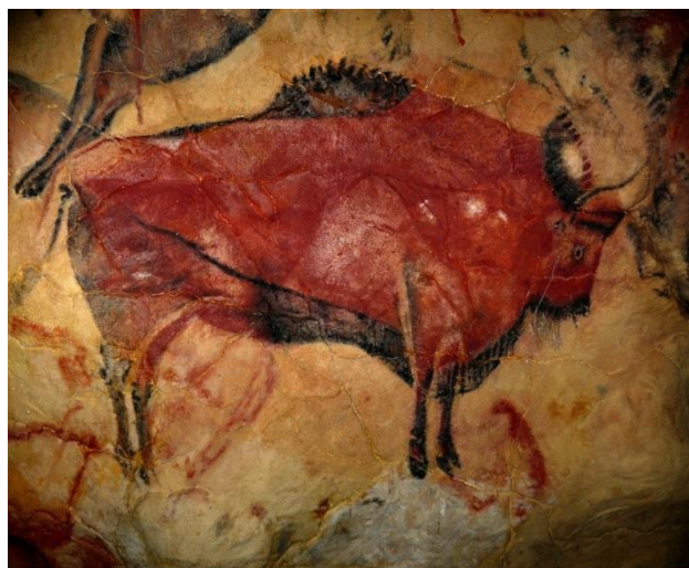
M4 Höhlenmalerei aus Altamira, Alt-Magdalénien (Spanien)