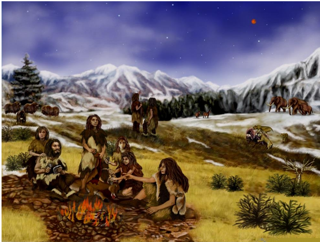
M3 Künstlerische Darstellung einer Familie in der Altsteinzeit