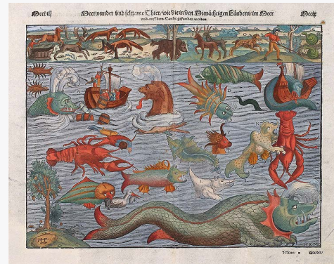
„Meerwunder vnd seltsame Thier“ von Sebastian Münster, erstellt ca. 1544.

Aufgabe 1: Welche grundlegenden Unterschiede bestehen zwischen dem Reisen früher und heute?