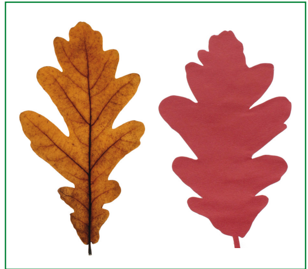
Original und Scherenschnitt

Ein herzförmiges Blatt mit Stiel und Adern – wenn Kinder Laubblätter aus dem Gedächtnis zeichnen, greifen sie in der Regel auf stereotype Darstellungsformen zurück. Dass ein Laubblatt aber sehr unterschiedliche Konturen haben kann, erfahren die Schüler in dieser Einheit. Genaues Hinsehen und die Arbeit mit dem Motivsucher zahlen sich aus. Zeichnerische Vorübungen bereiten die Kinder optimal auf die Königsdisziplin, das „Zeichnen“ mit der Schere, vor. Die daraus gewonnenen Laubblattmotive werden in fünf Bildern nach unterschiedlichen Kompositionsprinzipien angeordnet und geben den Schülern nebenbei einen Einblick in serielle Kunst.