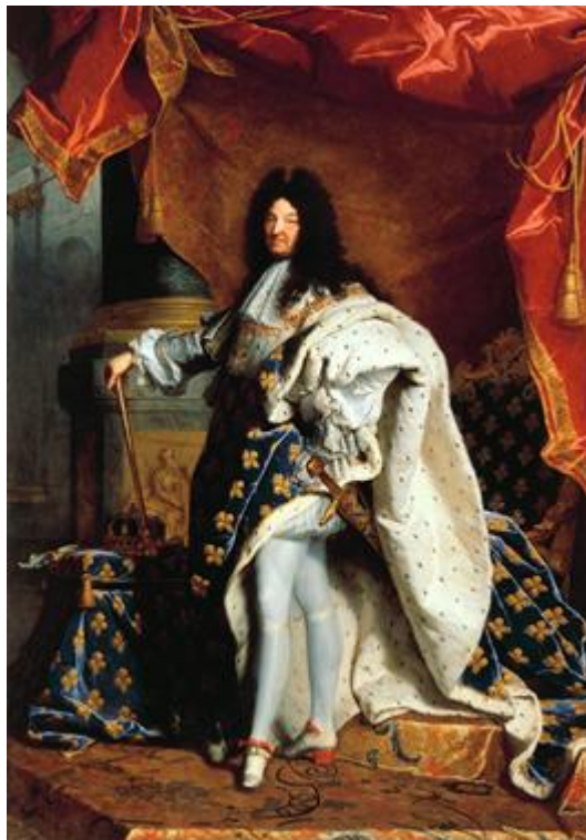
M1 Ludwig XIV. im Krönungsornat (Porträt von Hyacinthe Rigaud, 1701).

Das Bild ist heute im Louvre von Paris ausgestellt.