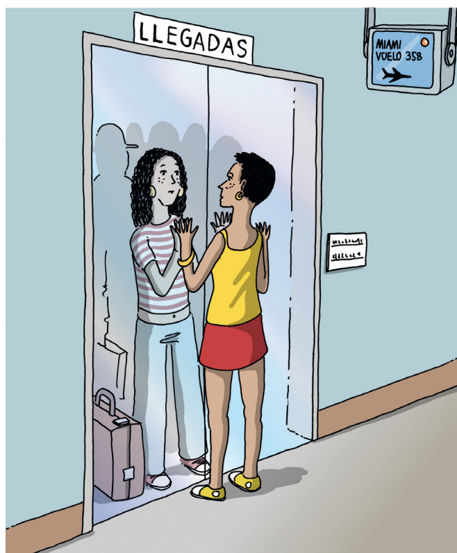
Lisa und Yolanda – zwei Lebensweisen treffen aufeinander