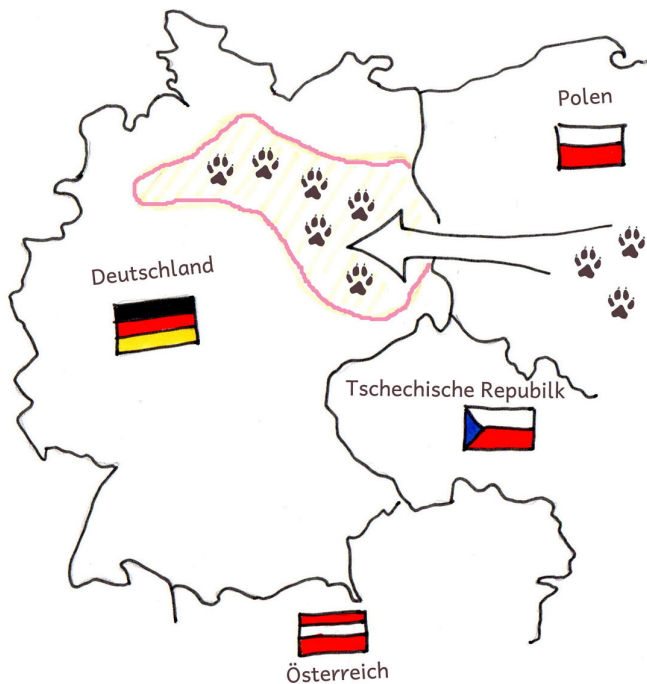
Die Wiedereinwanderung der Wölfe nach Deutschland

Im Jahr 1904 wurde in Deutschland der letzte frei lebende Wolf erschossen. Danach waren die Wölfe in Deutschland für lange Zeit ausgerottet. Doch vor einigen Jahren sind die Wölfe nach Deutschland zurückgekehrt.