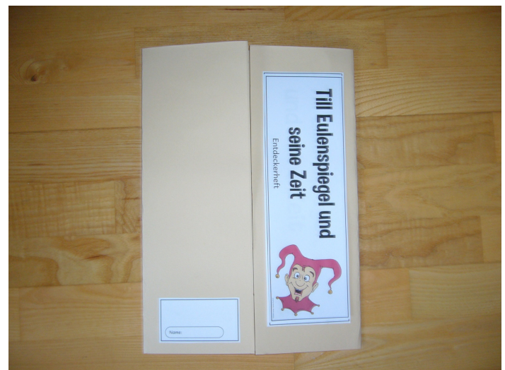
Das Entdeckerheft von außen (Gestaltungsvorschlag)