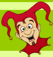
Illustration: Hans-Jürgen Krahl

Bis heute ist unklar, ob Till Eulenspiegel wirklich gelebt hat oder nur eine Erfindung ist. Bekannt wurde er durch ein Geschichtenbuch mit ihm als Hauptfigur. Das Buch wurde 1510 erstmals gedruckt und erfreute sich gleich großer Beliebtheit. Angeblich wurde Till Eulenspiegel 1300 in Kneitlingen bei Braunschweig geboren. Sein eigentlicher Nachname lautete „Ulenspiegel“. Dieser ist wohl aus einem Wortspiel entstanden. Es enthält den altdeutschen Begriff für „fegen“ (ulen) und einen Begriff aus der Jägersprache für Hinterteil (Spiegel). Mit der Zeit entwickelte sich daraus dann der Name Eulenspiegel. Till Eulenspiegel reiste in Norddeutschland umher und trieb so allerlei Schabernack mit Fürsten, Geistlichen und angesehenen Bürgern. Er zeichnete sich dadurch aus, dass er vieles wörtlich nahm, was seine Mitmenschen ihm sagten. Oft wird er als Schelm oder Narr bezeichnet. Doch Till Eulenspiegel war eigentlich schlau und recht klug. Er schaffte es, den Menschen der damaligen Zeit durch seine Scherze einen Spiegel vorzuhalten und Probleme aufzudecken. Till Eulenspiegel starb wohl 1350 in Mölln im Herzogtum Lauenburg. Dort sollen auch seine sterblichen Überreste zu finden sein.