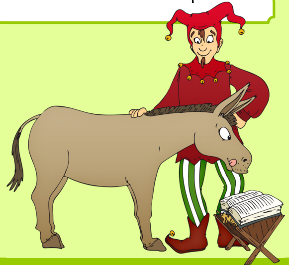
Illustration: Hans-Jürgen Krahl

Das Wort Schwank stammt vom mittelhochdeutschen Wort „swanc“ ab. Es bedeutet so viel wie „Schlag“ oder „Fechthieb“. Die Bedeutung „witzige Erzählung“ bekommt das Wort erst im Mittelalter.