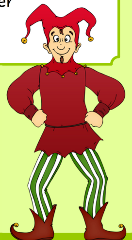
Illustration: Hans-Jürgen Krahl www.cliparts2go.de

Ich nehme viele Sprichwörter und Redensarten wörtlich.