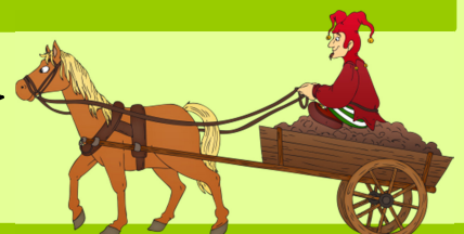
Illustration: Hans-Jürgen Krahl www.cliparts2go.de

Die Texte findest du im Lesebuch oder auf Blättern, die für dich kopiert wurden!