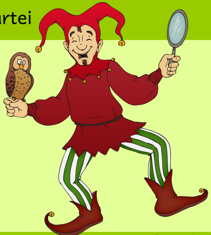
Illustration: Hans-Jürgen Krahl

© Matabe-Verlag Daniela Rembold Illustration: Hans-Jürgen Krahl www.cliparts2go.de