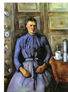
Paul Cézanne, Frau mit Kaffeekanne