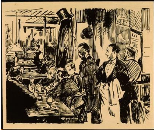
Edouard Manet, Im Café Guerbois

Paul Cézanne sitzt gemeinsam mit den Malern Auguste Renoir und Édouard Manet im Pariser Café Guerbois.