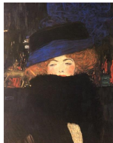
Gustav Klimt Dame mit Hut und Federboa

Im Jahr [redacted] starb Gustav Klimt in [redacted].