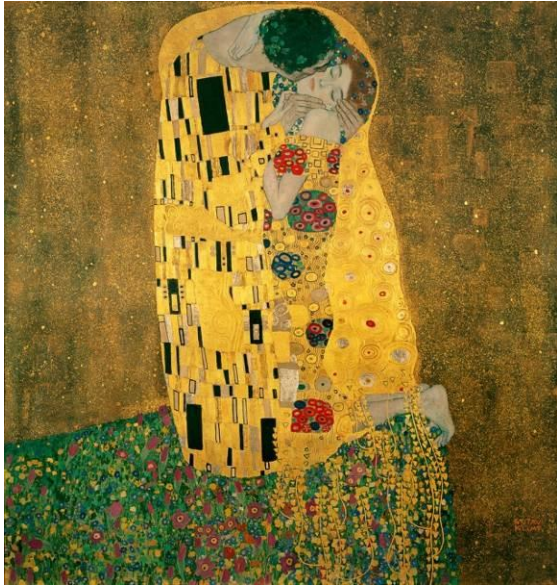
Gustav Klimt, 1908 Der Kuss

Gustav Klimt unternahm immer wieder zahlreiche Auslandsreisen. Er fotografierte viel. Auf einer Italienreise holte sich Gustav Klimt wichtige Inspirationen für seine „ Goldene Periode “. Im Jahr 1908 entstand das berühmte Gemälde „ Der Kuss “.