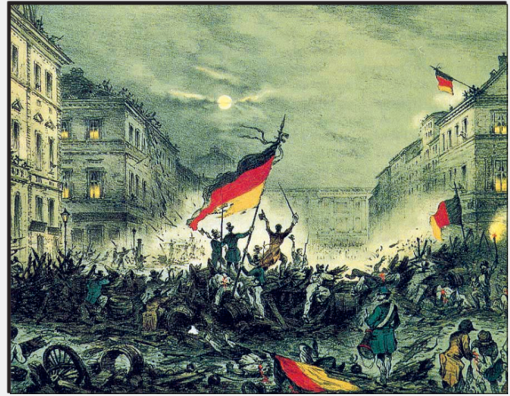
Jubelnde Revolutionäre 1848 in Berlin

1848/1849 kam es auch in Deutschland zu einer Revolution (= Deutsche Revolution). Revolutionäre setzten sich ein für Freiheit, Mitbestimmung und einen deutschen Einheitsstaat. Vorübergehend gab es sogar eine in Frankfurt/Main tagende Nationalversammlung, die hauptsächlich aus gebildeten Bürgern, Akademikern, hohen Beamten (keine Arbeiter!) bestand. Diese Nationalversammlung arbeitete nach langen Diskussionen eine deutsche Verfassung mit für das Volk vorgesehenen Grundrechten (Meinungsfreiheit, Pressefreiheit, Glaubensfreiheit...) aus. Die deutsche Kaiserkrone wurde dem König von Preußen angeboten, doch dieser lehnte sie ab. Auch diesmal scheiterten die Bemühungen um Demokratie am Widerstand der Herrschenden. Die adligen Herrscher ließen die Revolution durch Soldaten niederschlagen.