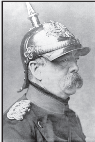
Otto von Bismarck