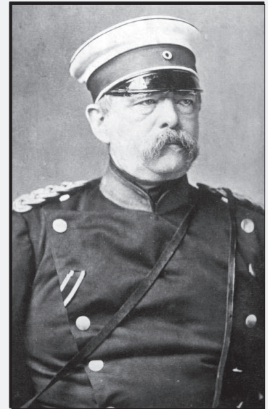
Bismarck im Jahr 1870

1898: _____ Bismarcks im _____ Friedrichsruh (bei Hamburg)