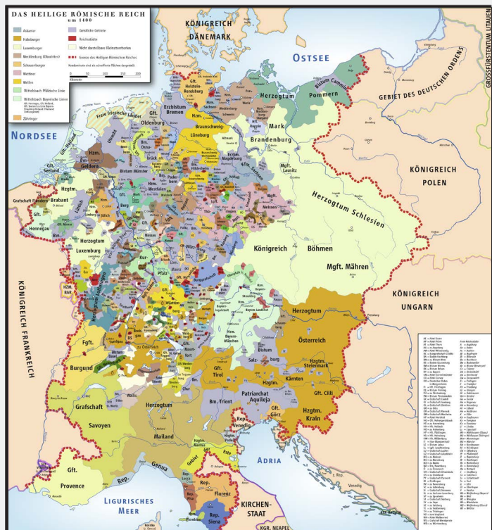
Heiliges Römisches Reich um 1400

Verglichen mit heute war damals das Leben für die allermeisten Menschen hart oder sogar sehr schwer. Auf dem Lande mussten Leibeigene und viele arme Bauern für ihren jeweiligen Besitzer bzw. Grundherren schuften, Bauern mussten Frondienste und Abgaben leisten. Das Leben der Bauern war geprägt von Arbeit, während die Grundherren ein weit besseres, angenehmes Leben führten. Generell lässt sich bezogen auf die damalige Zeit sagen: Je ärmer die Menschen waren, desto kürzer war in der Regel das Leben. Ganz viele Menschen wurden nur etwa 30-40 Jahre alt. Aufgrund fehlender medizinischer Versorgung starben auf dem Land und in den Städten zahlreiche Frauen/Mütter sowie Babys/Kinder bei der Geburt oder bald darauf. Auch durch Seuchen (Pest, Typhus, Pocken ...) kamen in großer Zahl Menschen ums Leben. Im Weiteren litt die Bevölkerung unter Hungersnöten.