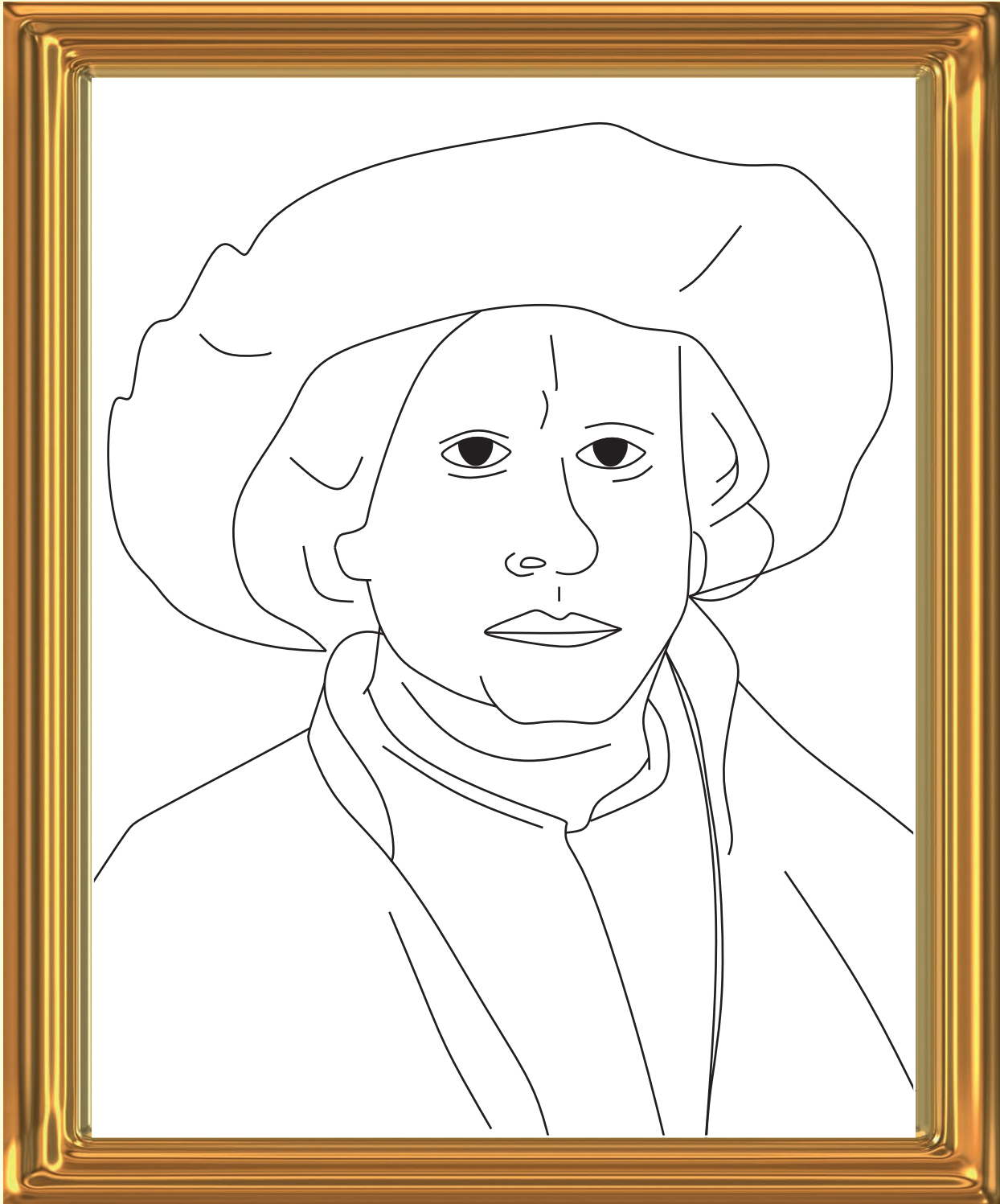
Rembrandt Selbstporträt um 1655

Rembrandt erhielt viele Aufträge, Porträts gegen ein Honorar zu fertigen. Sich selber malte er oft. Als dieses Selbstporträt entstand, war er 49 Jahre alt. Schaue es dir an und beschreibe es. Male es unten in Farben deiner Wahl an. Male dich mit Pinsel und Tuscharben auf einem großen Blatt Papier aus deinem Zeichenblock.