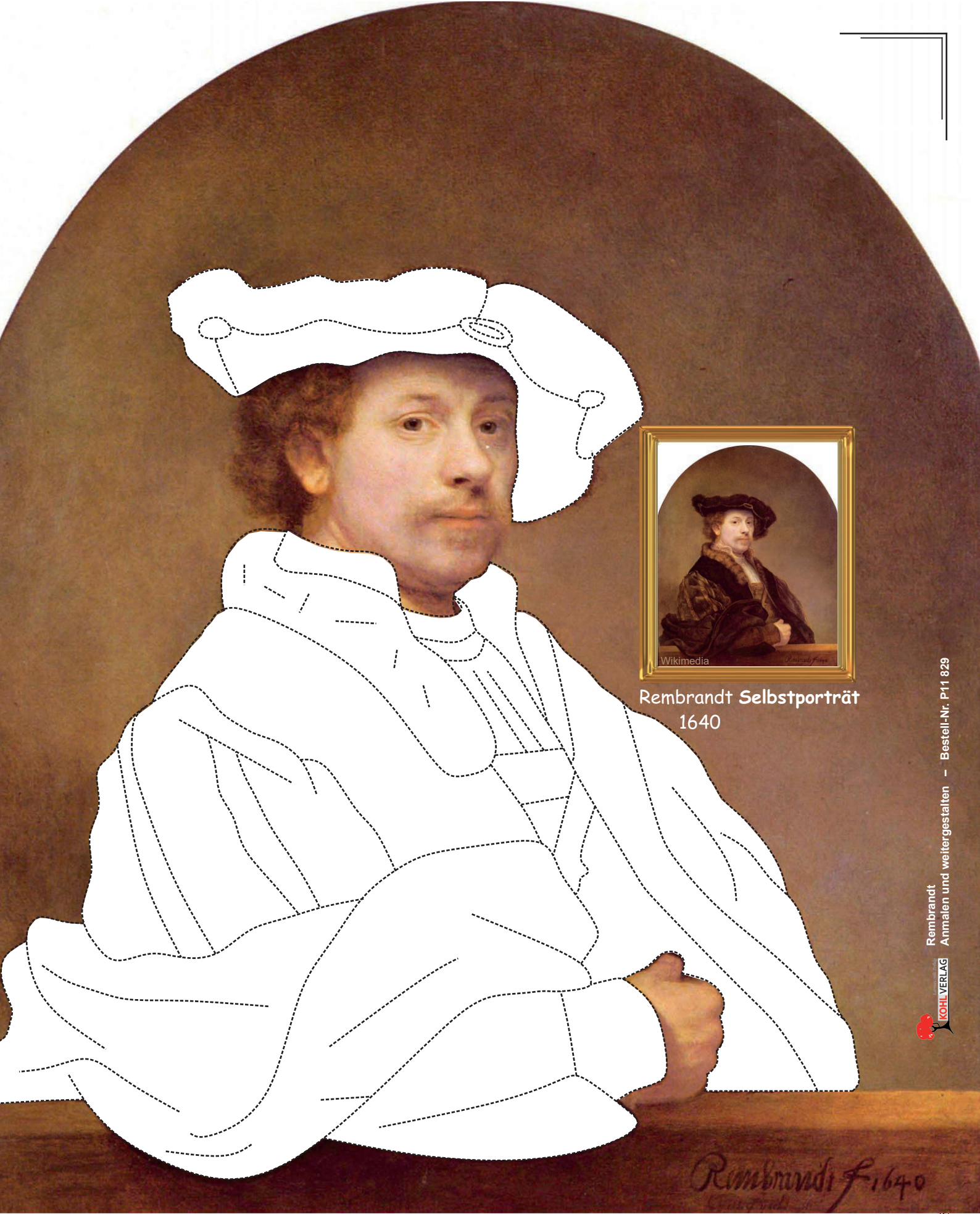
Rembrandt Selbstporträt 1640

Rembrandt Anmalen und weitergestalten – Bestell-Nr. P11 829