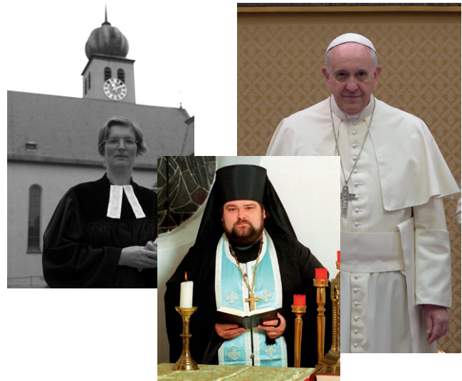
PfarrerIn, Priester und Papst – ein friedliches Nebeneinander?

Ihre Schüler erkunden in Einzel-, Partner- und Gruppenarbeit die Symbole des Christentums und mithilfe von Informationstexten, Fotos und Recherchen die Gemeinsamkeiten sowie Unterschiede der drei Konfessionen. Sie diskutieren außerdem über Ihren eigenen Glauben und Wiederholen das Erarbeitete, indem sie zentrale Begriffe den Konfessionen zuordnen.