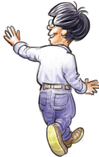
f) Auf Wiedersehen, Öczke!