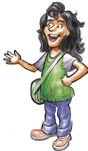
b) Hallo, Öczke!